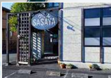
選べるオムライスランチパック プチSASAYAオムライス(サラダ付) 1,000円