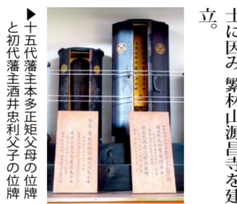
▲十五代藩主本多正矩父母の位牌と初代藩主酒井忠利父子の位牌