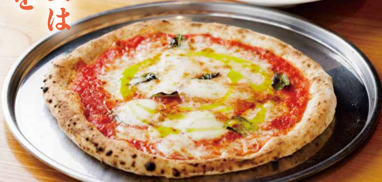
ランチ自家製バジルのマルゲリータ(サラダつき) 1,958円

※価格は全て税込です ※掲載内容は取材時(10月上旬)のものです。価格、店舗情報は変更となっている場合があります