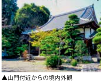
▲山門付近からの境内外観