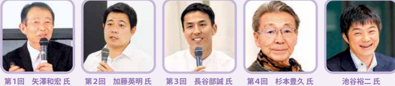
第1回 矢澤和宏氏 第2回 加藤英明氏 第3回 長谷部誠氏 第4回 杉本豊久氏 池谷裕二氏

◆記念事業について ①生徒用机・椅子の寄付は、生徒用机576台、生徒用椅子576脚を寄付。②今年度卒業生による記念講演は、1.矢澤和宏氏(静岡新聞社読者プロモーション局)、2.加藤英明氏(静岡大学教育学部准教授)、3.長谷部誠氏(元サッカー日本代表キャプテン)、4.杉本豊久氏(元成城大学文芸学部英文学教授)※引続き令和7年度～11年度毎年1人実施予定。③アメリカ研修 令和6年8月23日から8月30日まで / アメリカ テキサス州 ライス大学・ウツドラズ高校への訪問・授業見学・学生との交流・NASAの見学等。 ※引続き令和7年度～9年度実施予定。 / 参加者:生徒4名 引率教員1名。④運動部トレーニング機器の整備。⑤100周年記念誌の発行。 ほか ◆記念式典について 令和6年11月20日に静岡県武道館にて開催します。記念式典に続き、池谷裕二 東京大学薬学部教授による記念講演が開催されます。なお、一般入場はありません。