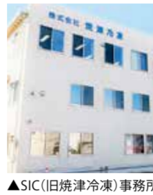
▲冷蔵庫と物流センター

いちまるは昭和三十八年に浜当目に千トンの冷凍庫を建設し、焼津冷凍水産加工業をスタート。その後、協同組合を設立し、聡が理事長に就任。昭和四四年には、焼津市上野間に千トン級の冷凍庫を新設しました。が社長となりました。 三〇年後も必要とされる会社に創業五〇周年は「第三の創業期」