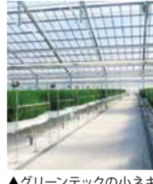
▲グリーンテックの小ネギ栽培

伊達巻一筋80年、全国でも珍しい伊達巻だけを製造している食品会社です。最大の特徴は、約50%を占める卵の配合率。 ふんだんに卵を使い、昔ながらの石臼製法で白身魚をゆっくりにすり潰すことで、艶やかな伊達巻の味と食感を生み出しています。