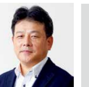
▲SIC(旧焼津冷凍)事務所棟

いちまるは昭和三十八年に浜当目に千トンの冷凍庫を建設し、焼津冷凍水産加工業をスタート。その後、協同組合を設立し、聡が理事長に就任。昭和四四年には、焼津市上野間に千トン級の冷凍庫を新設しました。が社長となりました。 三〇年後も必要とされる会社に創業五〇周年は「第三の創業期」